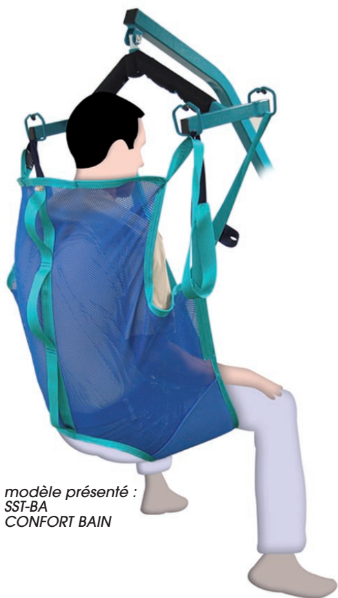
modèle présenté : SST-BA CONFORT BAIN

Les modèles Confort-mousse et Bain comportent des jambières rembourrées avec de la mousse imperméable.