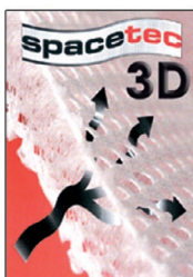
dossier SPACETEC polyester 3 dimensions